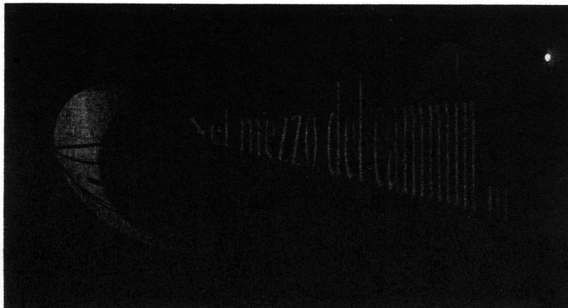
Insegnamento a distanza.

D'altro canto non deve essere dimenticato che il mondo delle telecomunicazioni si sta profondamente modificando e questa continua e costante evoluzione rappresenta una delle principali componenti dello sviluppo della società. Le reti di telecomunicazione, per esempio, consentono il trasporto e la gestione dell'informazione, costituiscono una fondamentale risorsa infrastrutturale per favorire lo sviluppo dei rapporti interpersonali e delle attività economiche e sociali. E non solo: la rapida successione delle innovazioni ha moltiplicato gli strumenti di comunicazione e