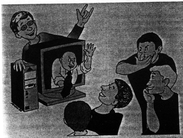
Tele-scuola in una tele-classe.

la loro capacità tecnica di trasmissione. Si parla cioè di reti intelligenti, di reti a commutazione di pacchetto, di satelliti di telecomunicazioni, di fibre ottiche, di video conferenze, telelavoro, telebanking. Il mondo è stato e sarà sempre di più dominato da chi riuscirà a gestire il maggior numero di informazioni possibili: la telematica fornisce i dispositivi e le metodologie per amministrare il nuovo potere.