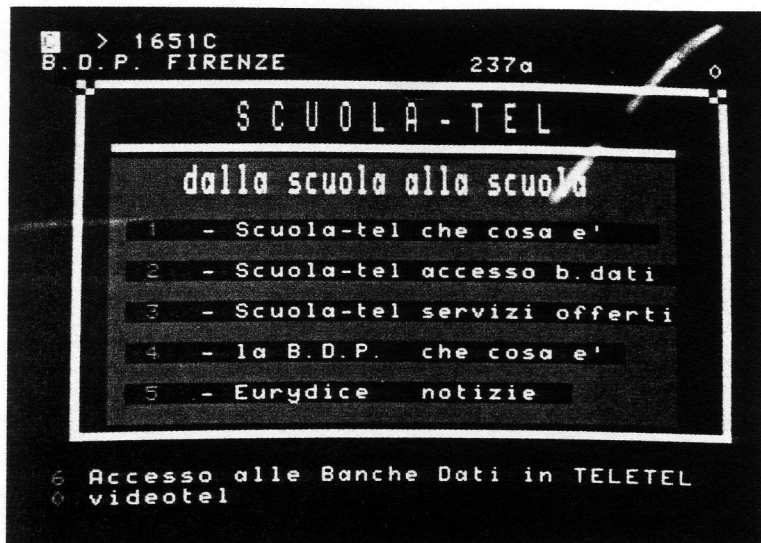
Videotel - Scuolatel.

Scuolatel è un servizio del Ministero della Pubblica Istruzione, rivolto a tutta