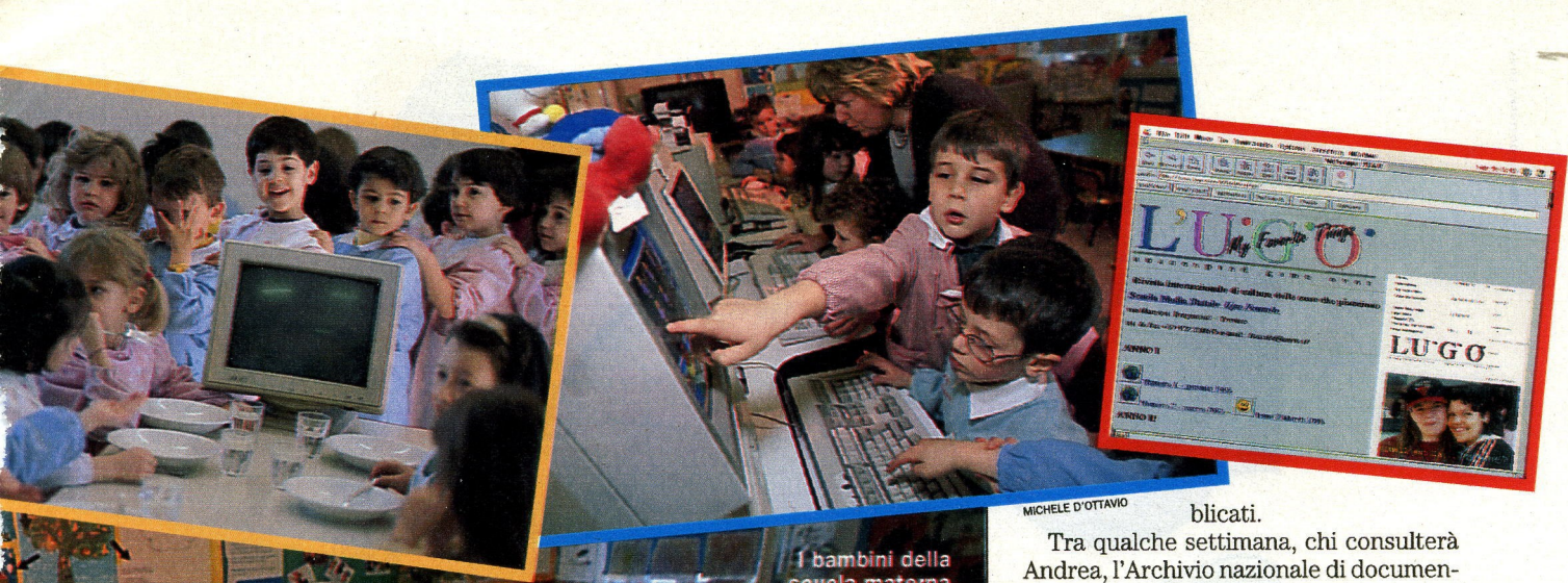
I bambini della scuola materna statale di Mondovì con i loro computer. In alto, a destra: il sito Internet "L'U.G.O."