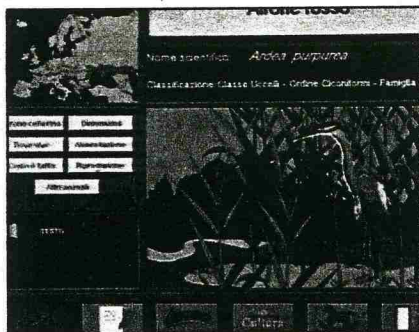
Queste immagini sono tratte da due ipertesti italiani: "Ecosistemi" (sopra), e "Ecolandia"

Perché tanta diffidenza? «Perché questi strumenti modificano la sostanza stessa dell'apprendimento», continua Antinucci. Giocando con un ipertesto, il bambino segue un percorso di conoscenza del tutto personale, guidato più dalle proprie curiosità che da un programma stabilito a priori. Questo tipo di apprendimento è quindi difficilmente controllabile dall'adulto e soprattutto difficilmente "misurabile" con gli strumenti tradizionali. Non è solo la paura, tuttavia, a frenare presidi e insegnanti: spesso, anzi, i veri problemi sono di