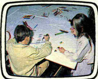
Sopra, la redazione (è composta da 20 bambini). Si può telefonare allo 02/70107223 per le proposte.

È una vera novità per i piccoli dai 4 anni in su. Si tratta di un programma televisivo da sogno: senza pubblicità, senza violenza, con notizie e giochi interattivi tutti ideati da una baby redazione. Su Tele+1 dal 1° dicembre: gli abbonati possono vederlo tutti i pomeriggi dalle ore 17 alle 19.