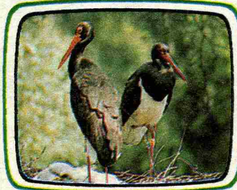
La cicogna bianca per nidificare preferisce i campanili, quella nera invece le cime degli alberi.

Da due secoli non si vedeva più, ma improvvisamente ha fatto ritorno. Nel parco del monte Fenera, vicino a Novara, un esemplare rarissimo di cicogna nera, l'unica in Italia, ha fatto il nido. E sono anche nati quattro cicognini. Alla nascita il loro piumaggio era bianco. Crescendo diventerà scuro.