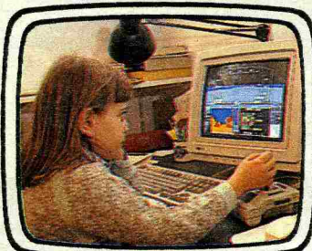
Già da dieci anni le scuole dell'Emilia Romagna hanno adottato i computer fin dalla scuola materna.

Se hai un computer e ti piace giocare per studiare, c'è il Progetto Kidslink, che attraverso una rete telematica collega i ragazzini dai 10 anni in su con i loro coetanei di 50 Paesi del mondo. Per saperne di più chiama il numero 051/519292 e lascia un messaggio. Sarai richiamato.