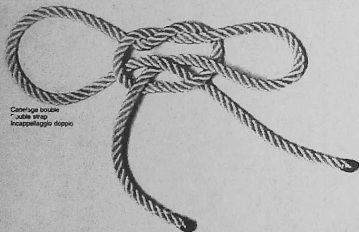
Capelago double "jubile strap" Incapellaggio doppio