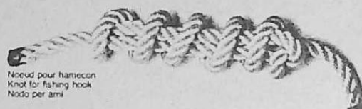
Noeud pour hameçon Knot for fishing hook Nodo per ami