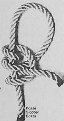
Bosse Stopper Bozza