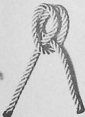
Noeud parlato Clove hitch Nodo parlato