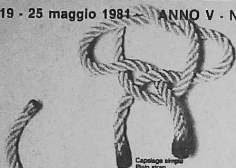
Capelago simple Plain strap Incapellaggio semplice

ANNO V - N. 19 - 25 maggio 1981 - ANNO V - N. 19 - 25 maggio 1981