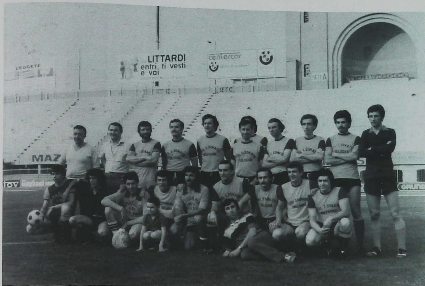
Campionato provinciale UISP 1978/79 categoria Amatori 1 a classificata.