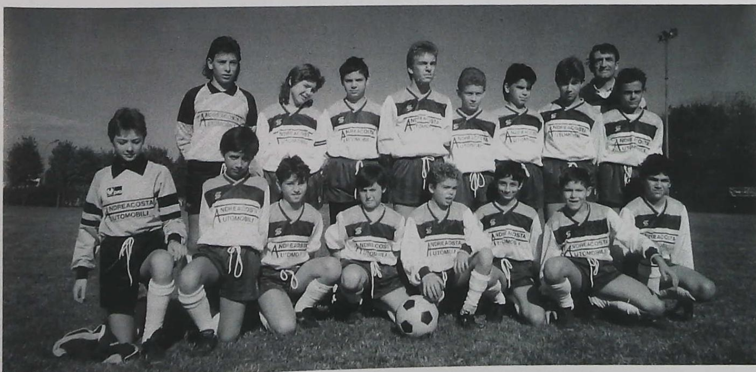
Campionato Regionale UISP 1987/88 categoria Piccoli Azzurri B 1ª classificata.

Il Circolo può contribuire a ricostruire questo patrimonio culturale combattendo la cultura dell'isolamento e della competizione che caratterizza questi anni anche con iniziative apparentemente marginali come la Radio, la Tombola o il Computer Club.