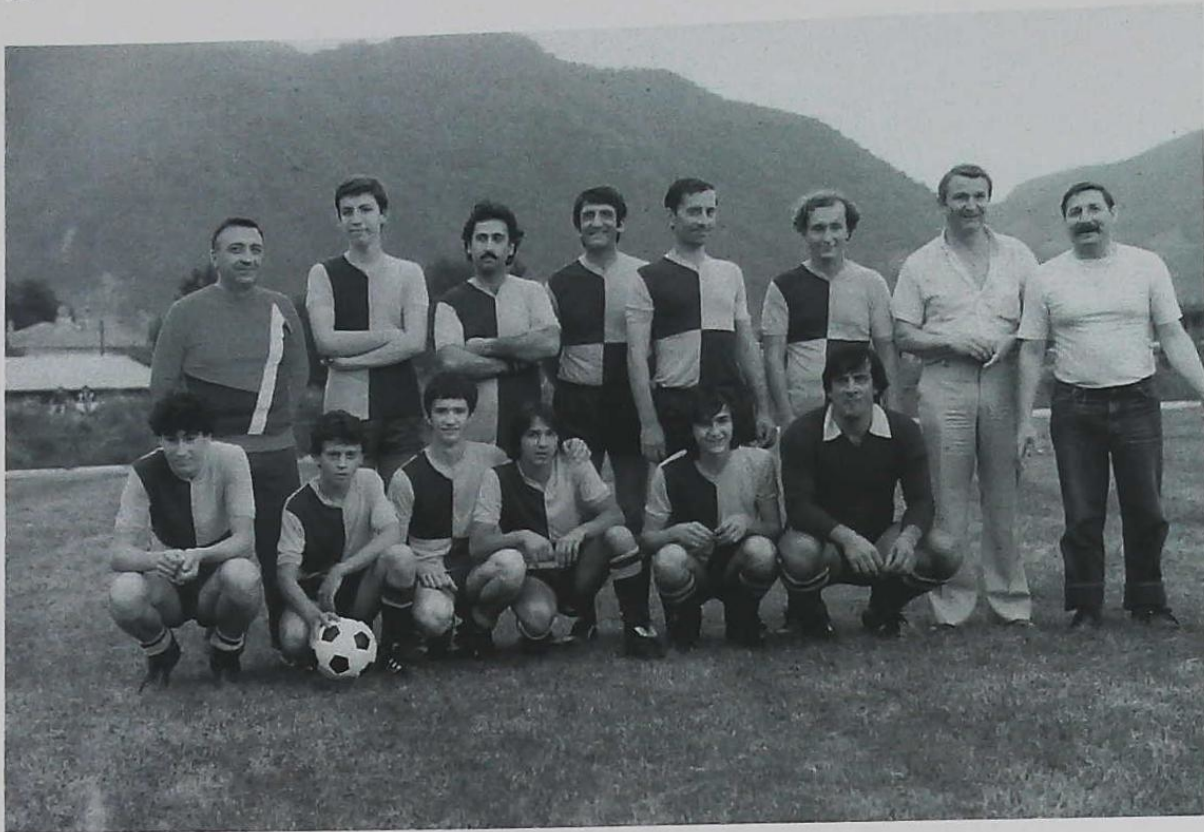
La squadra che ha partecipato agli incontri amichevoli in Jugoslavia.