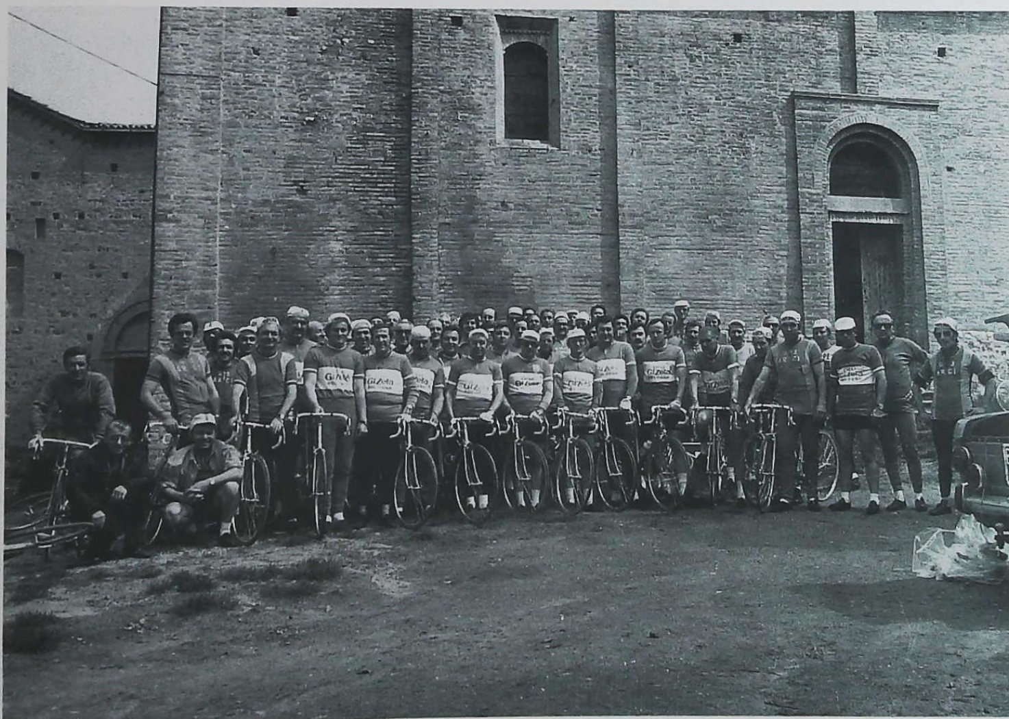
Il gruppo di cicloturisti «G. Leopardi».

Partecipavamo a raduni di media lunghezza 40/60 Km. e quelli molto più impegnativi con distanze maggiori e difficoltà altimetriche. Non stiamo ad elencare il numero delle nostre partecipazioni, ma possiamo fare una media annuale di 40/50 uscite cadauno. Vogliamo citare città, mete delle nostre presenze: Trento, Verona, Ravenna, Ferrara, Firenze ecc. ove non siamo stati presenti solo come gruppo di cicloturisti, ma hanno partecipato anche familiari ed amici, con pullman, affinché la bicicletta non fosse di primaria importanza ma servisse da tramite per aggregare più