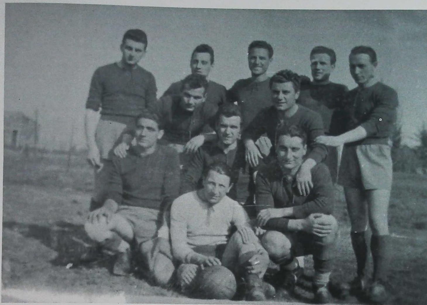
Una delle prime squadre di calcio della Polisportiva S. Donato.

sportivo verticistico e selettivo allora e oggi vigente.