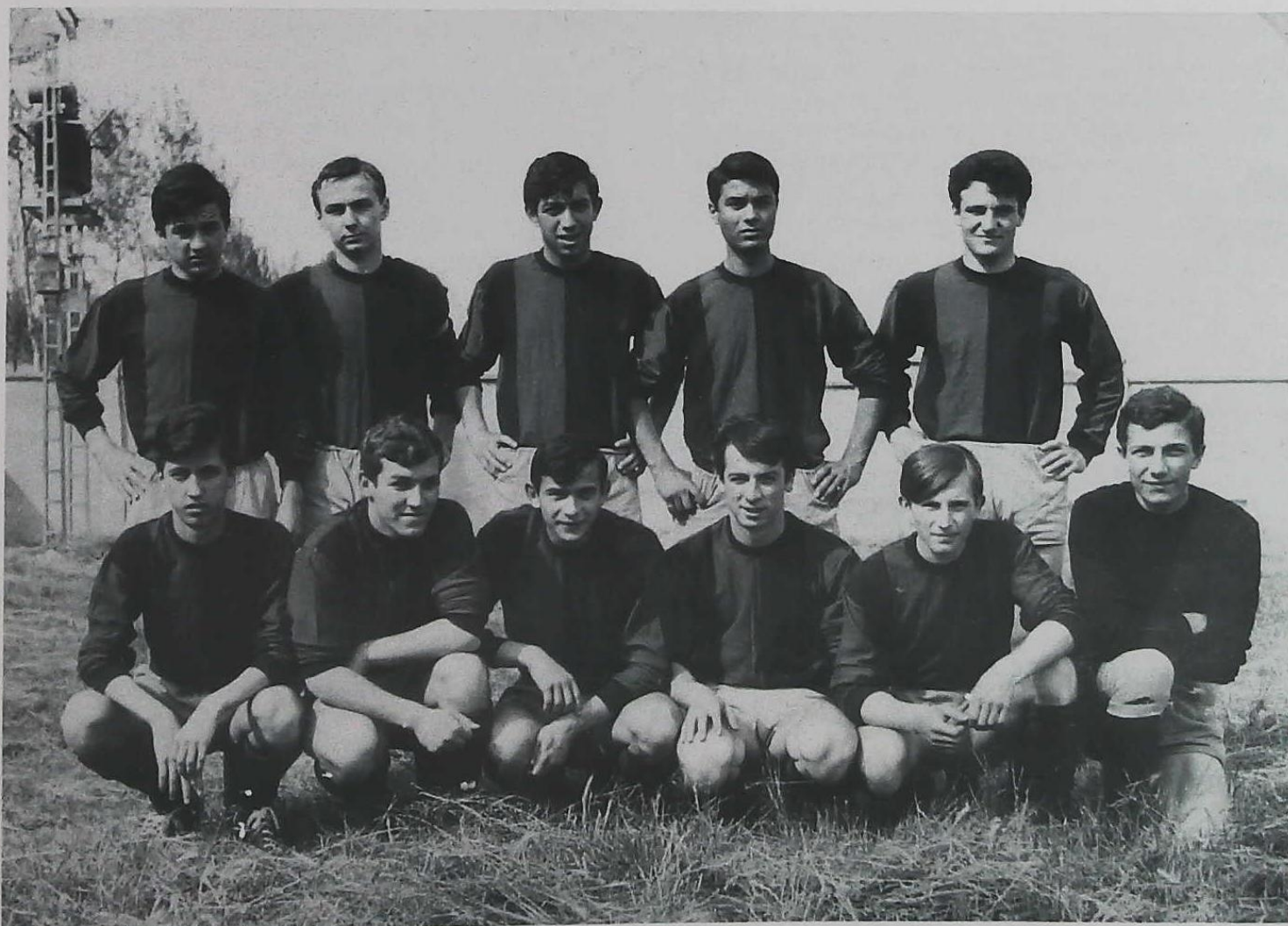
Campionato italiano UISP 1964/65 categoria Juniores 1ª classificata.

Da quel momento bisognava lavorare per ricucire una frattura sociale, isolando al contempo quelle frange che si richiamavano alla violenza come forma politica. Lo scontro politico basato sul confronto di idee, e sulla partecipazione venivano soffocati dal clima di diffidenza e sospetto di quelli che sarebbero stati chiamati «gli anni di piombo». Occorreva rilanciare il discorso ripartendo dalle strutture associative di base in cui il meccanismo di solidarietà non si era disgregato. La Radio, scossa dai fatti del marzo, tentò di rilanciare da una parte il discorso dell'informazione, dall'altra volle comunque mantenere il proprio ruolo di punto di aggregazione giovanile e luogo di produzione culturale. Va ricordato il gruppo «Proposta S.F.» che nato all'interno della radio per condurre una trasmissione di fantascienza, continuò per anni a produrre una rivista a diffusione nazionale e cicli di film. Così come significative sono state le rassegne musicali, le feste organizzate dalla radio all'interno della Casa del Popolo, le iniziative con i centri giovanili co-