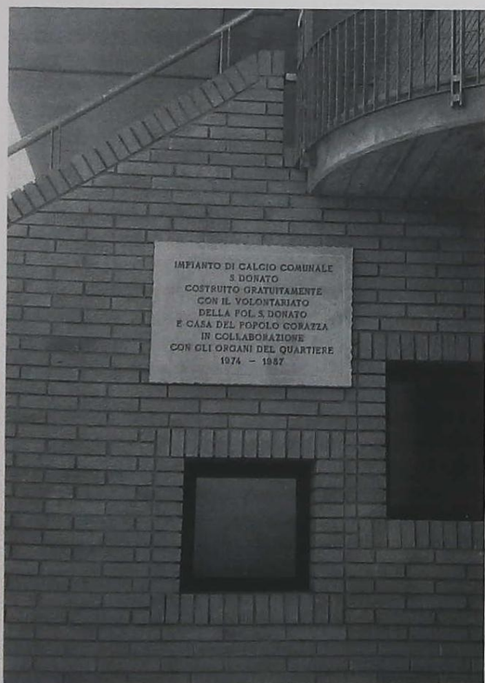
La targa posta a lato della tribuna del campo di calcio a testimonianza della collaborazione tra il volontariato della Polisportiva S. Donato, Casa del Popolo Corazza e quartiere.

Si è ripetuta così ancora una volta la grande esperienza del lavoro di persone di ogni età, di diplomati ed impiegati, per avere una struttura più rispondente all'esigenza di partecipazione e di socializzazione di tutto un quartiere. Si conferma in questo modo il grande valore del volontariato come promotore e sostegno della vita sociale — e non solo sportiva e ricreativa — e come apporto di valori positivi per tanti cittadini.