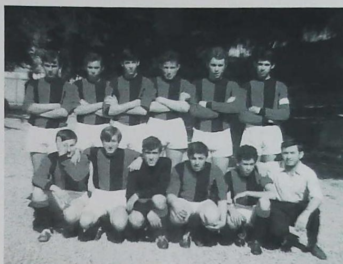
Campionato italiano UISP 1967/68 categoria Allievi 1ª classificata

I proventi della tombola vengono suddivisi tra la Casa del Popolo e la Polisportiva una parte utiliz-