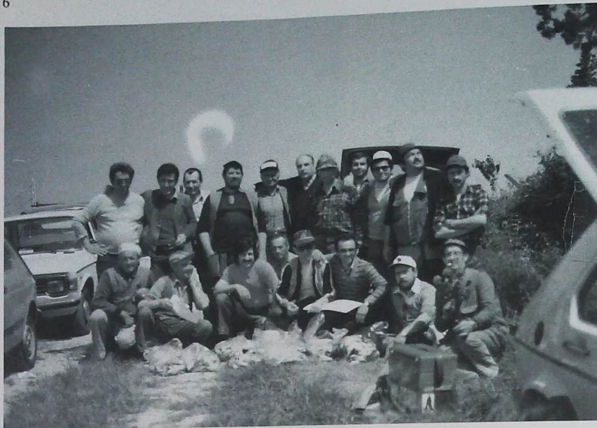
Il gruppo di pescatori della Polisportiva S. Donato «El Pavajon»