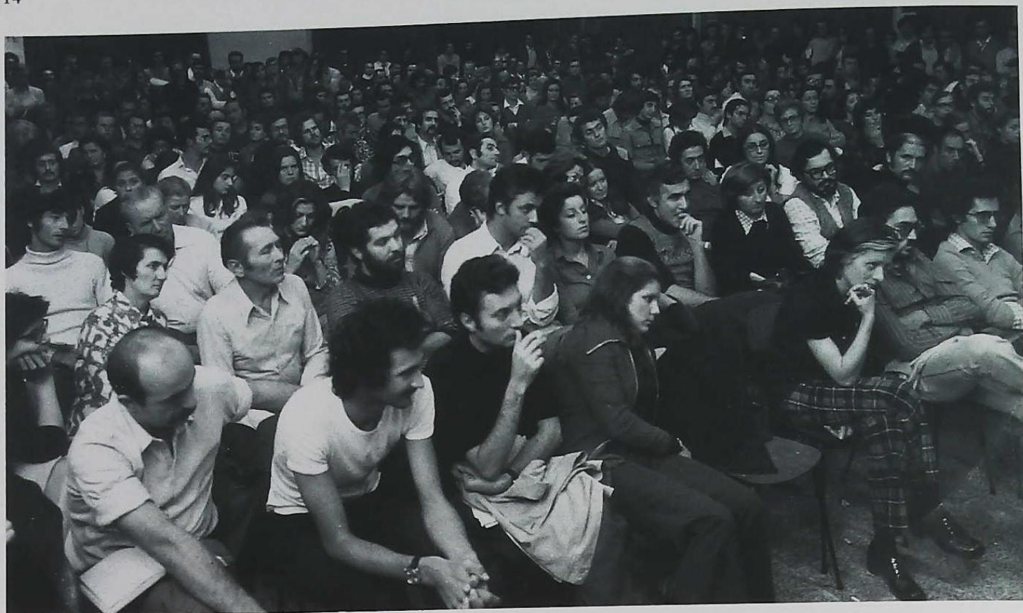
La sala Sirenella durante un dibattito.

munali al fine di valorizzare queste nuove strutture.