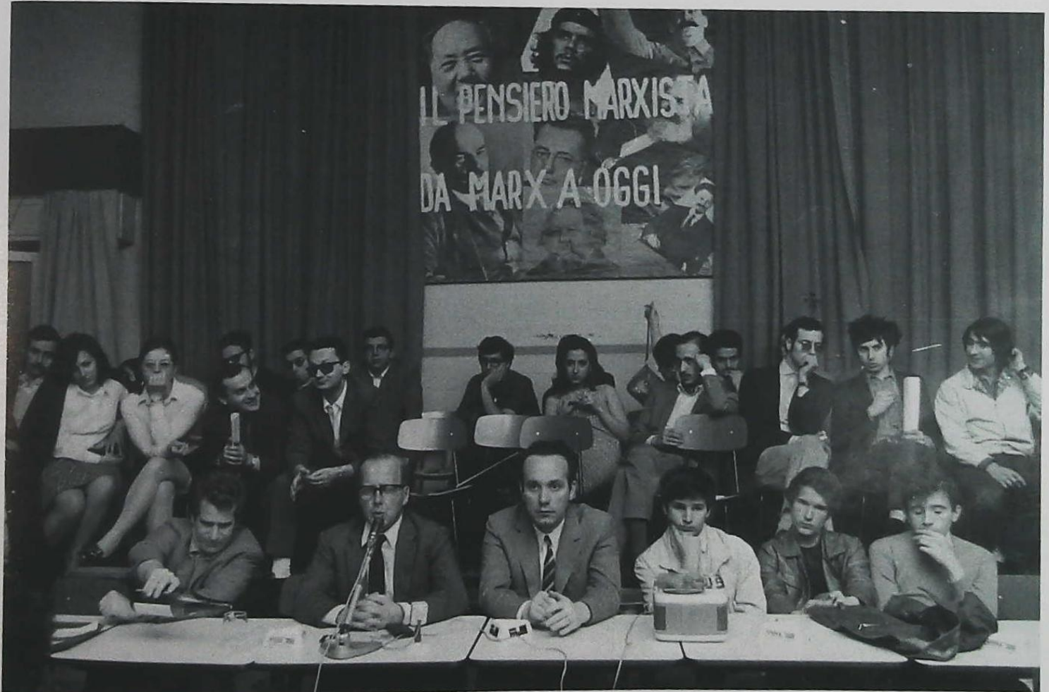
La sala Sirenella durante un dibattito.

La «fame» di marxismo delle nuove generazioni e comunque la contemporanea necessità di una rilettura del pensiero e della teoria marxista, così come si è venuta determinando storicamente, stanno alla base dell'intervento del Circolo sul piano del dibattito teorico e politico. Nella primavera del 69 è organizzato un primo «ciclo di